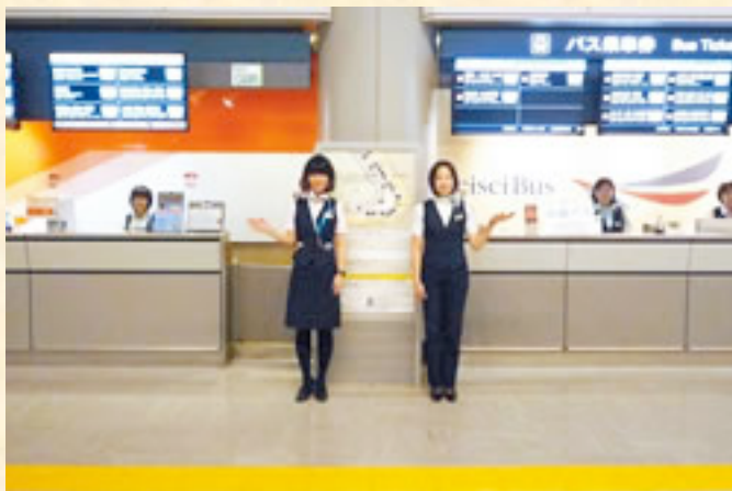
Bus-ticket counter at the airport.

http://rso.kek.jp/eng/Access/Narita.html